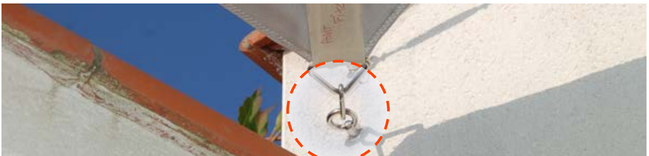
Point de prise de mesures :