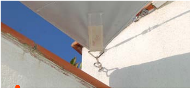
Point d'ancrage fixe (démontable par mousqueton)